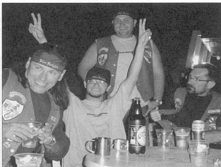
Radości nie było końca

Śniadanie, mimo lekkiego szumu w głowach smakowało. Pożegnaliśmy się z częścią zlotowiczów obiecując spotkania w przyszłym roku i nie koniecznie na Chorwacji.