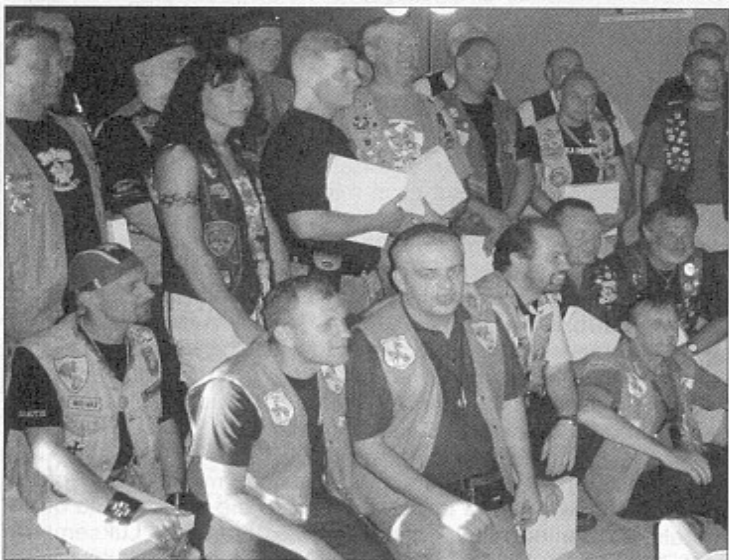
W grupie różnej

sce ich spotkania - wieje jak diabli, błyska się i grzmi a krople deszczu są chyba rozmiarów piłeczek do ping-ponga. Prędkość bliska zero ale twardo jedziemy. Przed samą granicą uspokaja się. Zatrzymujemy się na pasie ziemi niczyjej, jak określiliśmy odcinek między posterunkami austriackim a czeskim, by zrobić sobie zdjęcia przy ogromnym postaciu rycerzy na koniach, które w niesmaczny sposób mają wyeksponowaną swoją pleć.