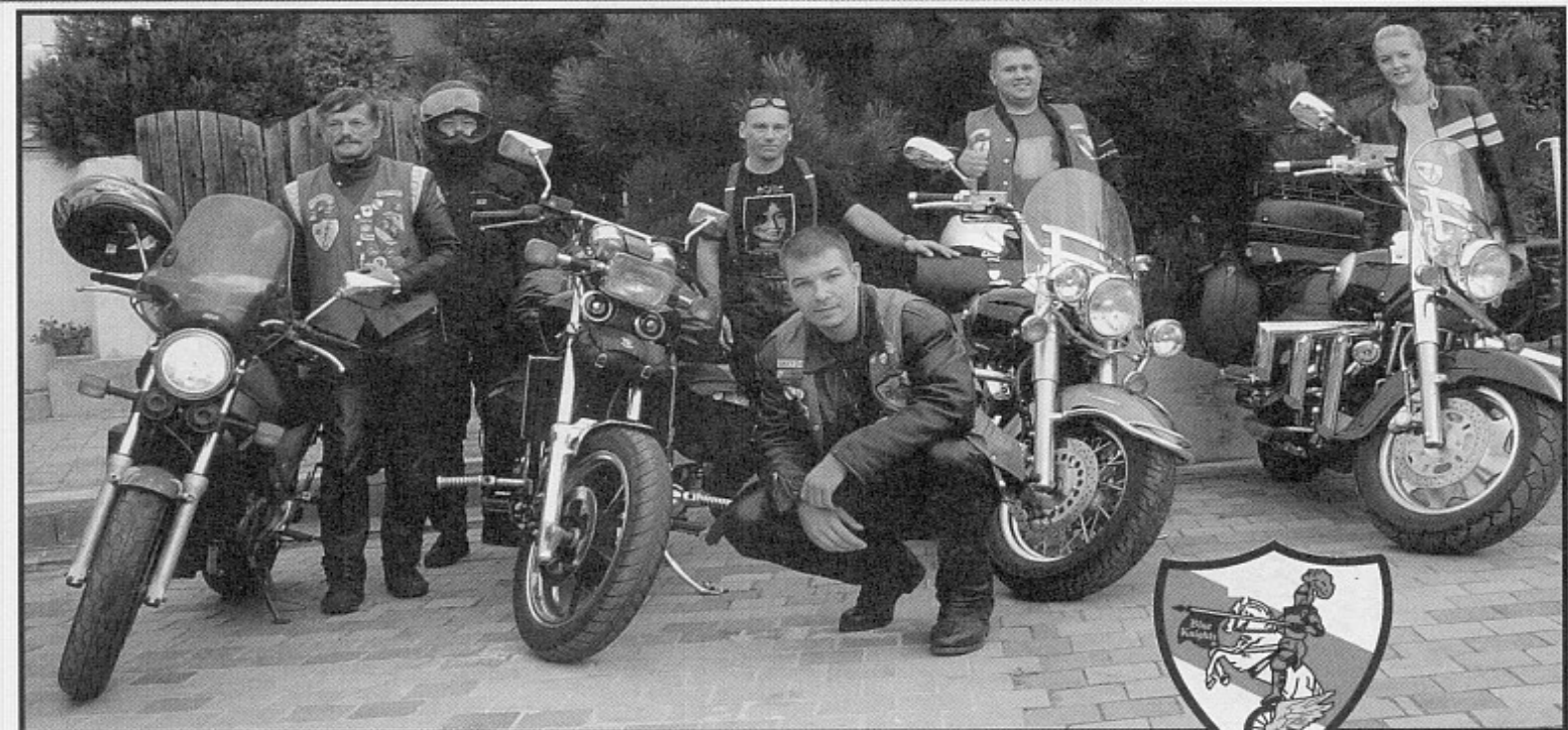
Grupa polskich motocyklistów w drodze na zlot

Międzynarodowy Zlot Blue Knights Chorwacja 2005